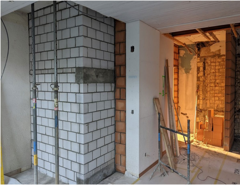
Arbeiten im Lehrerzimmer 1.OG